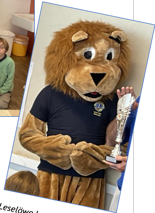
Leselöwe Leo präsentiert der Klasse fröhlich den Pokal